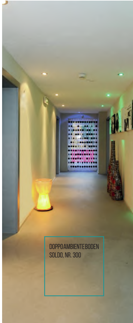
DOPPOAMBIENTE BODEN SOLDO, NR. 300