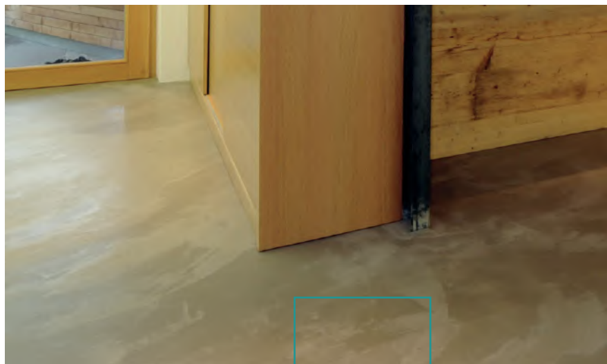
DOPPOAMBIENTE BODEN SOLDO, IBOD-15