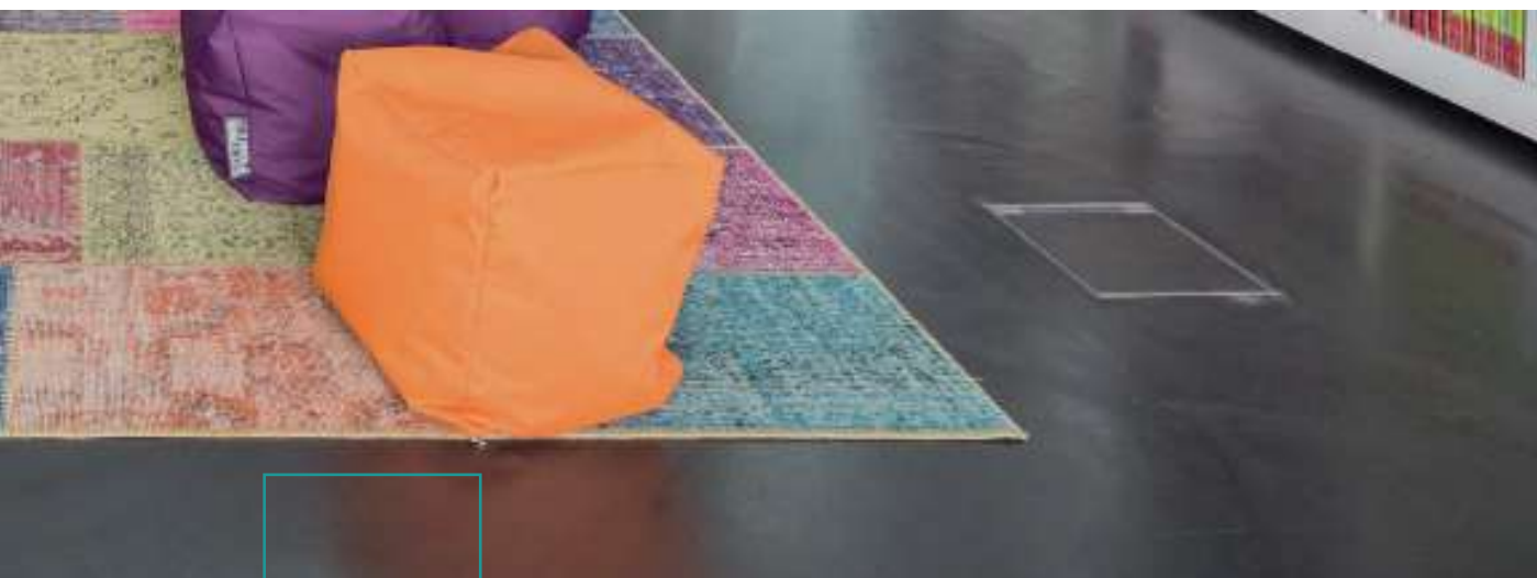
DOPPO AMBIENTE BODEN, IBOD-17

Die Darstellung des Farbtons kann abweichen und ist nicht farbverbindlich. Das Anlegen von einer Musterfläche ist zu empfehlen!