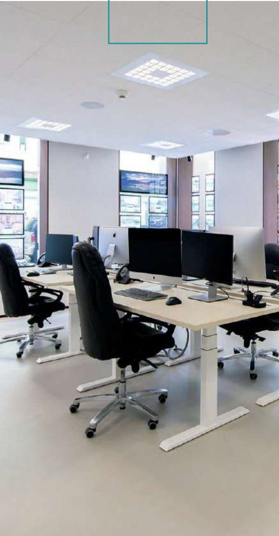
DOPPO AMBIENTE BODEN, IBOD-10