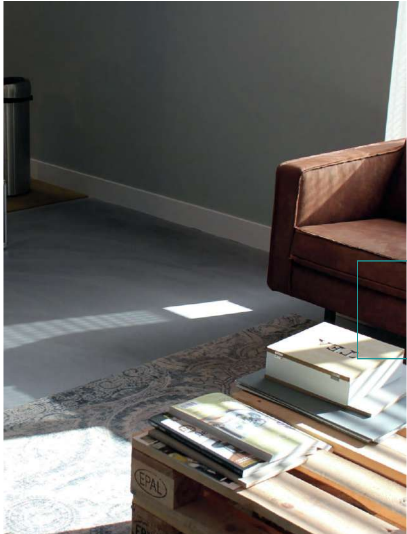
DOPPO AMBIENTE BODEN SOLIDO, NR. 58