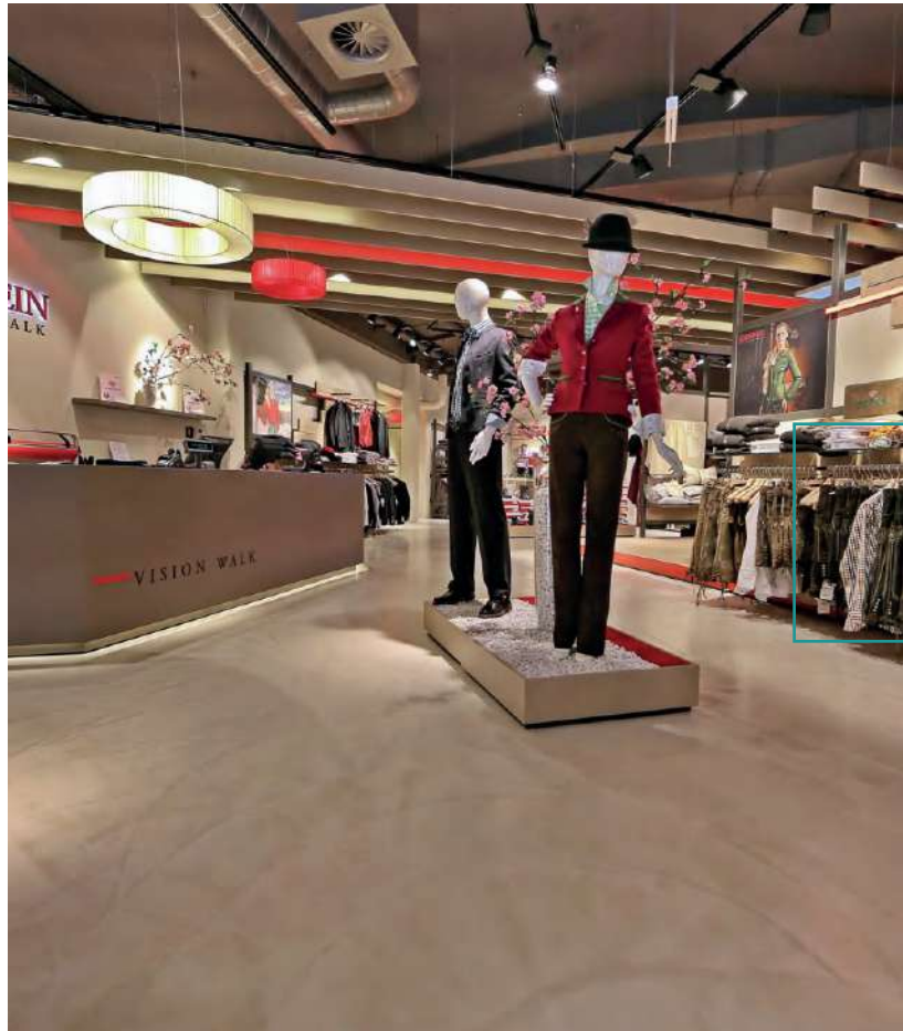
DOPPO AMBIENTE BODEN SOLDO, NR. 58