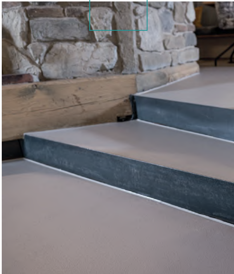
AMBIENTE PRO+ SN, IBOD-26