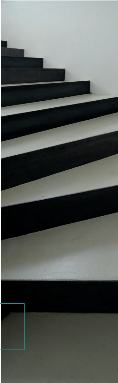
DOPPO AMBIENTE BODEN, IBOD-02